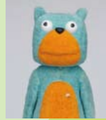
都合により欠席 ムッシュ熊雄 氏